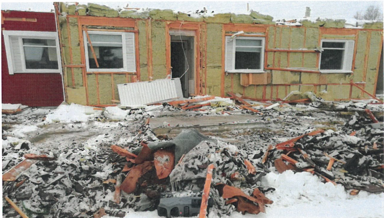
Kuva 6. Purettavien kattotiilien seassa oli myös ainakin purkupuuta ja muuta sekalaista purkujätettä.