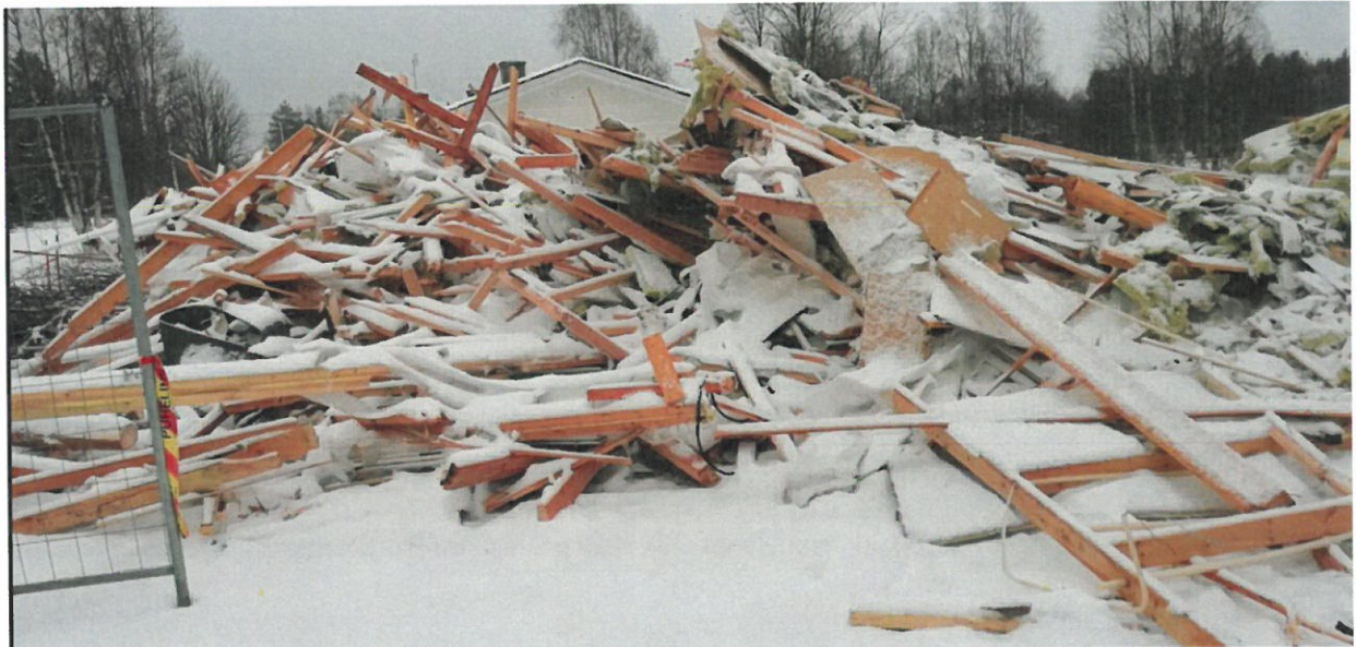
Kuva 2. Purkujätettä läjitettynä kiinteistöllä Kurkihyppyläntie 14.