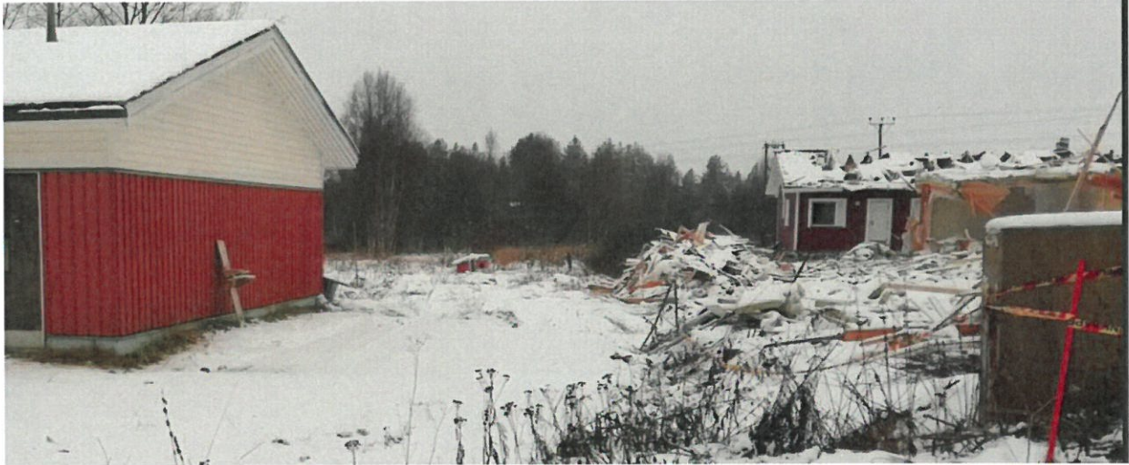
Kuva 9. Purkutyömaan rajaus edelleen asuttavasta talosta (Kurkihyppyläntie 12), sekä purkujätettä työmaan laidalla.