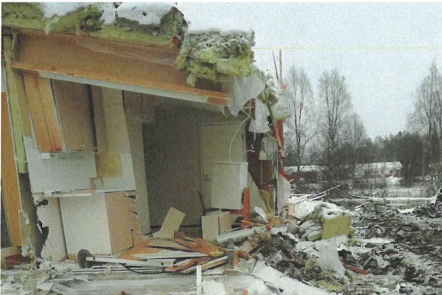
Kuva 8. Tarkastuksen perusteella voidaan todeta, että ainakin osassa huoneistoja oli vielä irtaimistoa sisällä. Esimerkiksi kuvassa jääkaappi.