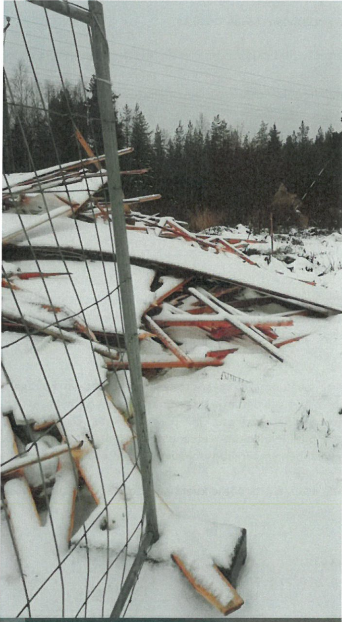
Kuva 11. Purkujätettä kuvattuna Kurkihyppyläntieltä (talo 14 a kuvaajan vasemmalla puolella).