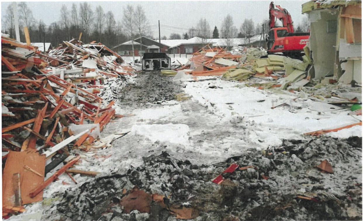
Kuva 5. Kattotiilet purettavista taloista oli levitetty ajouralle murskana kiinteistöllä Kurkihyppyläntie 14.