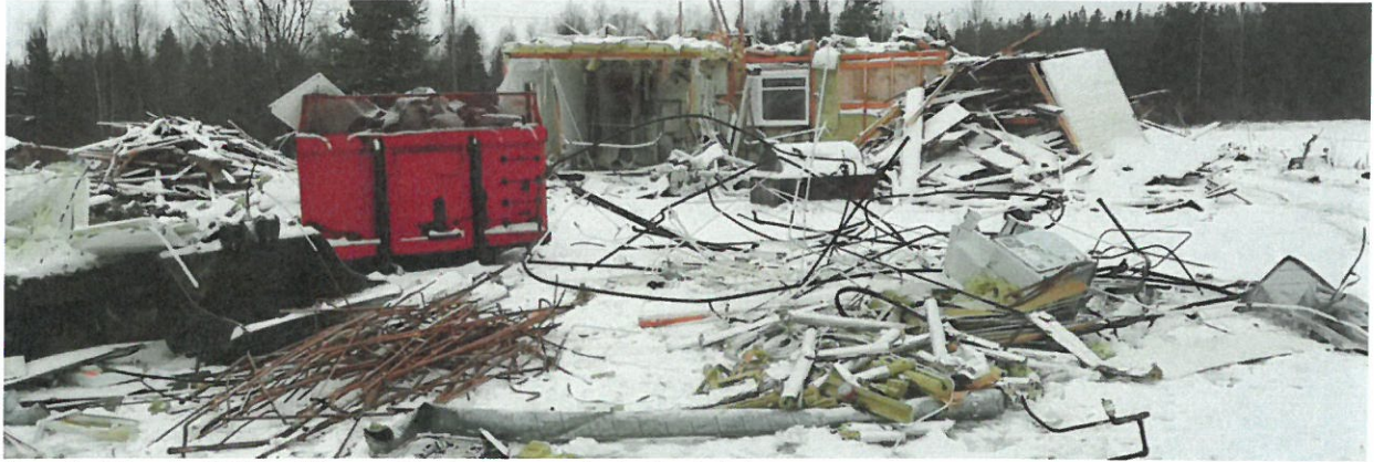
Kuva 3. Kiinteistöllä Kurkihyppyläntie 14 eroteltuja jätejakeita.