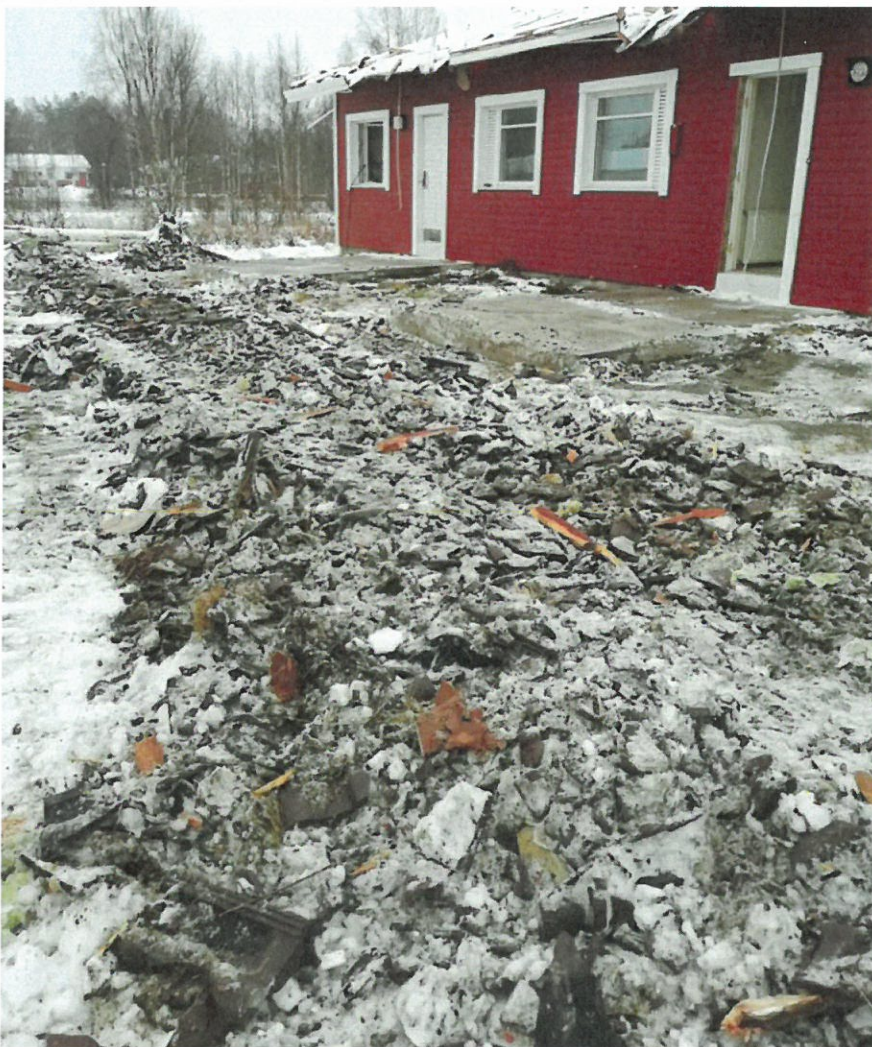
Kuva 4. Kattotiilet purettavista taloista oli levitetty ajouralle murskana kiinteistöllä Kurkihyppyläntie 14.