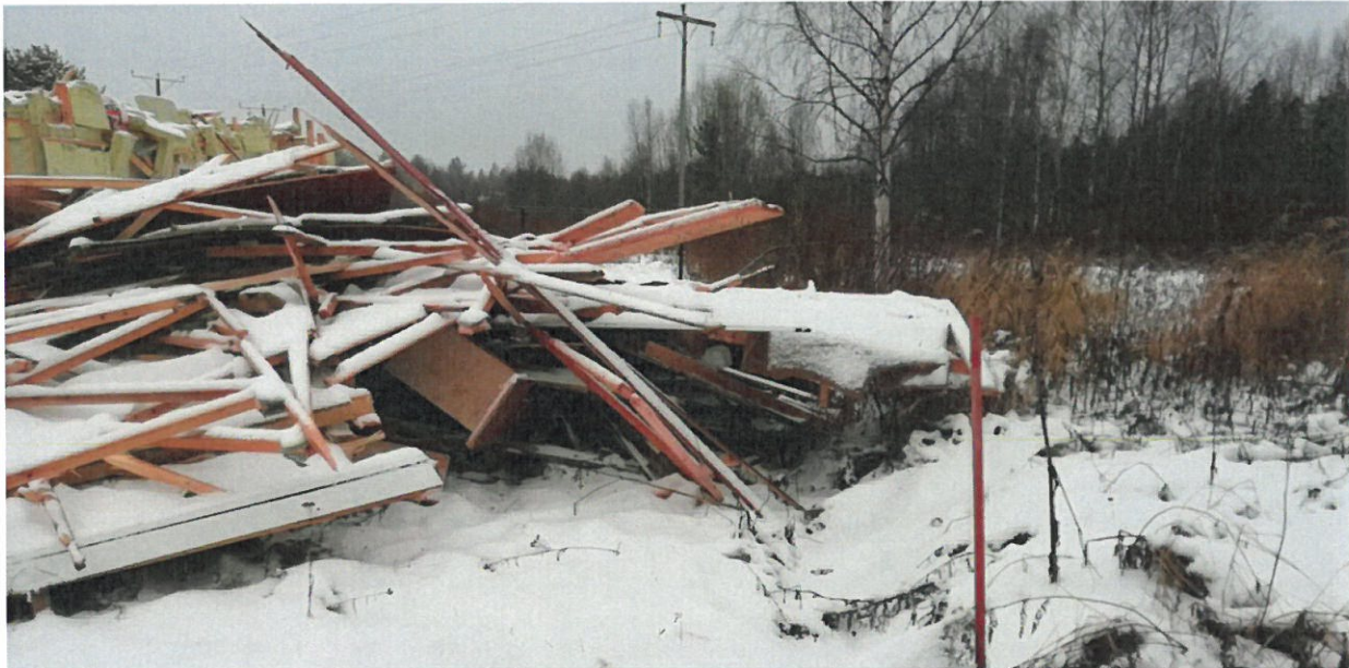
Kuva 10. Purkutyömaan rajaus Kurkihyppyläntie 14 a:n toisella puolella (tieltä kuvattuna talo 14 a kuvan vasemmalla puolella).