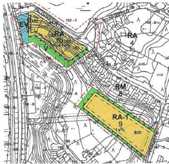
Kuvat 1 ja 2. Asemakaavan muutosalueen tavoitteellinen rajaus sekä ote voimassa olevasta asemakaavasta, jossa muutettavat rakennuskorttelit 9 ja 10.