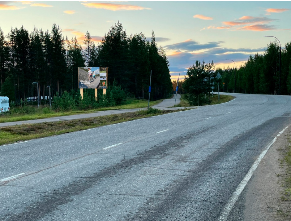
Mainostaulunäkymä liikenneympyrältä ajaessa Luostolle päin.

Kuvan leveys on 4 000 m ja korkeus 3 000 mm. Mainostaulun kokonaiskorkeus on 5 000–5 500 mm.