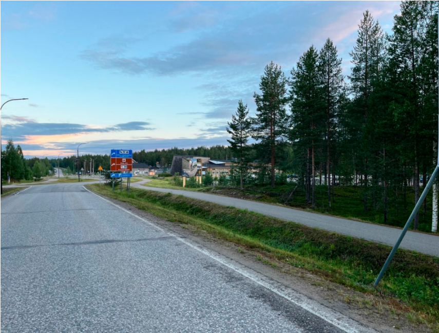
Mainostaulunäkymä Luoston suunnasta tultaessa, liikenneympyrää lähestyttäessä.